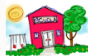
La scuola vista dai bimbi

Dal mese di aprile, la Pro Ticino conta una scuola in più: si tratta della scuola della sezione di Ginevra. Le altre scuole sono attive nelle sezioni di Basilea, Delémont e Zugo. In totale ci sono oltre 40 allievi.